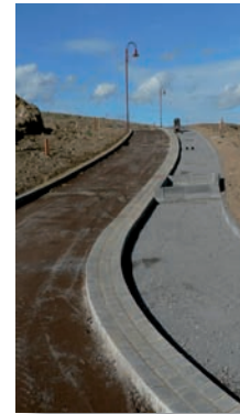
Baufortschritt September 2006

Es sind ausschließlich Einfamilienhäuser zulässig. Bebauung: Max. 1 1/2-geschossig mit seitlicher Bauhöhe bis zu 5,50 m und Firsthöhe bis zu 11 m. Drempel- und Sockelhöhen sowie Dachformen und Firstrichtung sind frei wählbar. Die Tiefe der Baufelder beträgt 15 m.