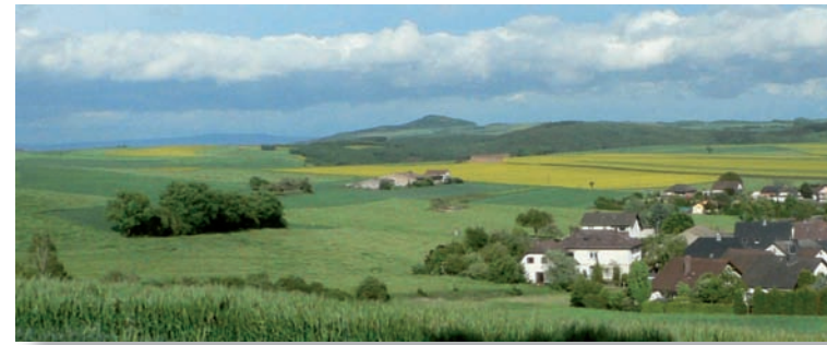
Fernblick vom Baugebiet auf das Maifeld und die Vulkaneifel

Die „Wellinger Spitze“ ist ein attraktives Wohngebiet mit insgesamt 22 individuell zugeschnittenen Baugrundstücken.